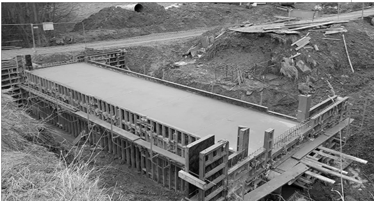
Budowa przepustu Sukówka w Kasinie Wielkiej

Pracownicy Referatu Inwestycji i Zamówień Publicznych Urzędu Gminy Mszana Dolna