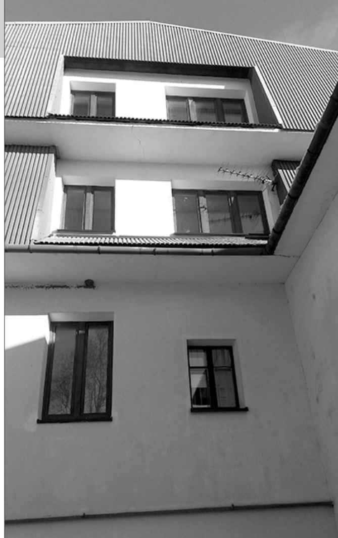
Budynek Ośrodka Zdrowia w Rabie Niżnej z nowymi oknami

Całkowita wartości zadania wyniosła 357 938,00 zł brutto. Na tę inwestycję Gmina otrzymała dofinansowanie ze środków Województwa Małopolskiego w wysokości 73 420,00 zł oraz z Rządowego Funduszu Inwestycji Lokalnych w kwocie w wysokości 150 000,00 zł . Pozostałe