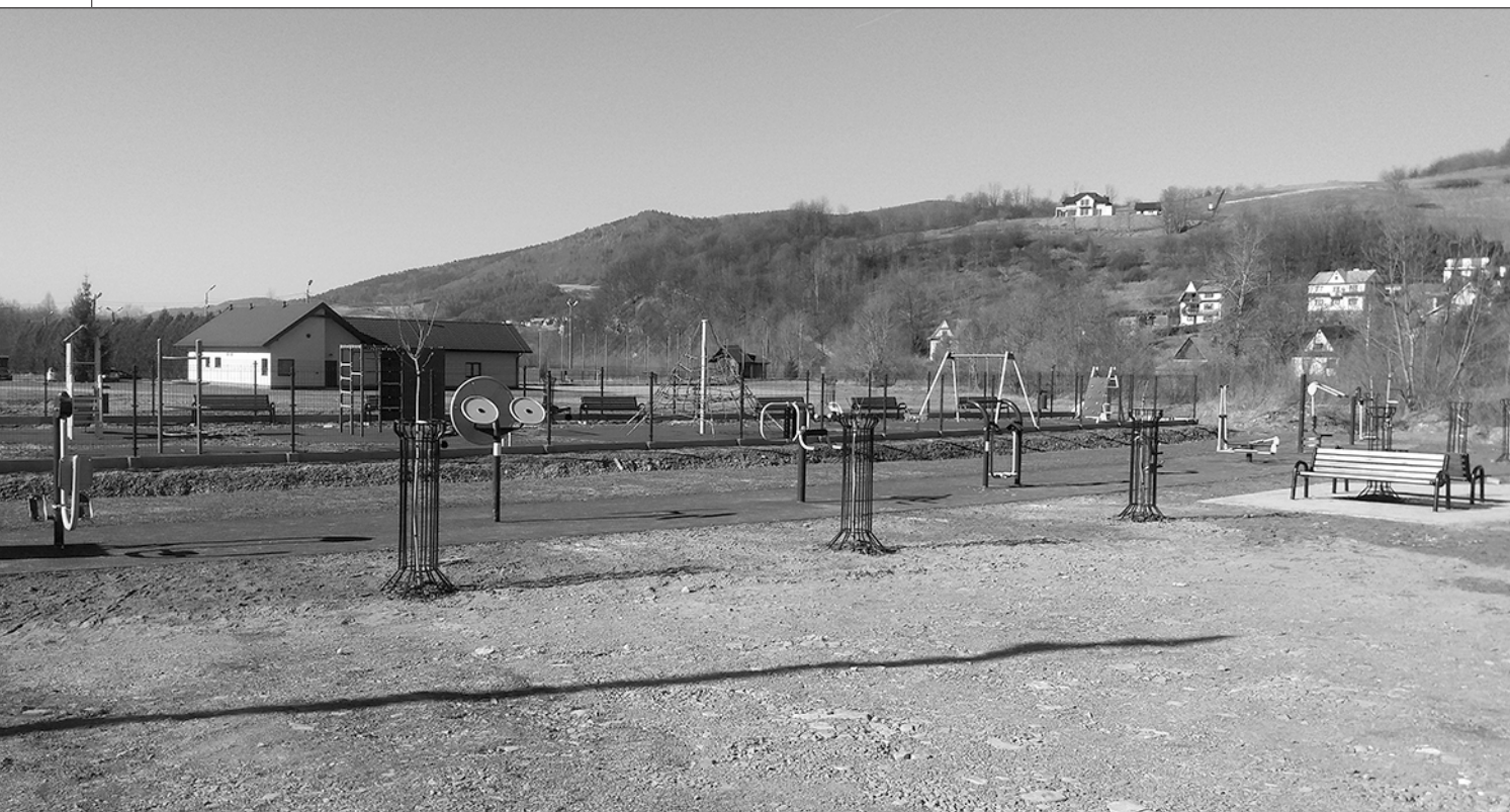
Otwarta Strefa Aktywności w Mszanie Górnej