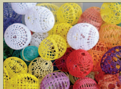
Zagorzańskie Targi Wielkanocne z mnóstwem atrakcji STR. 21