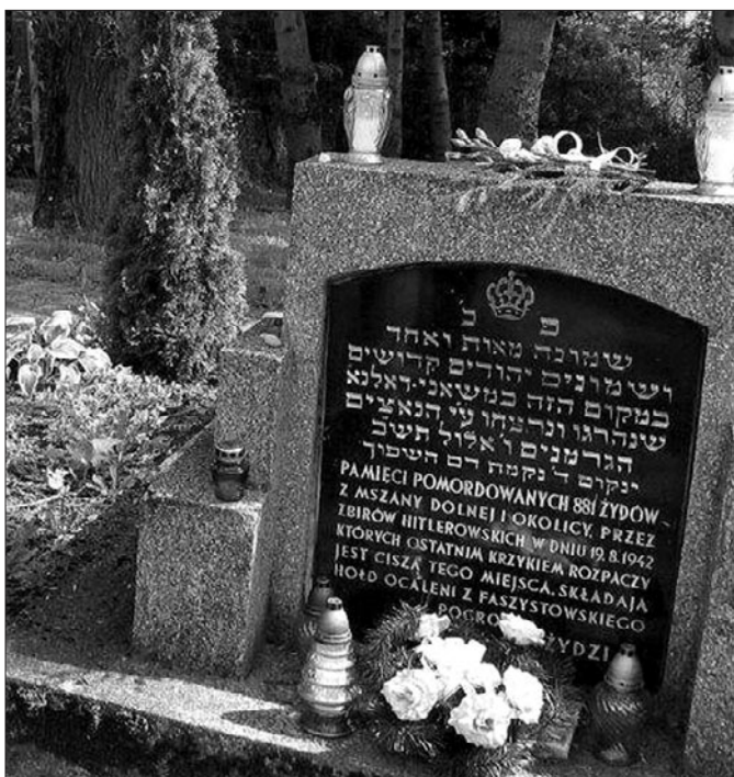
Zbiorowa mogiła Panskie