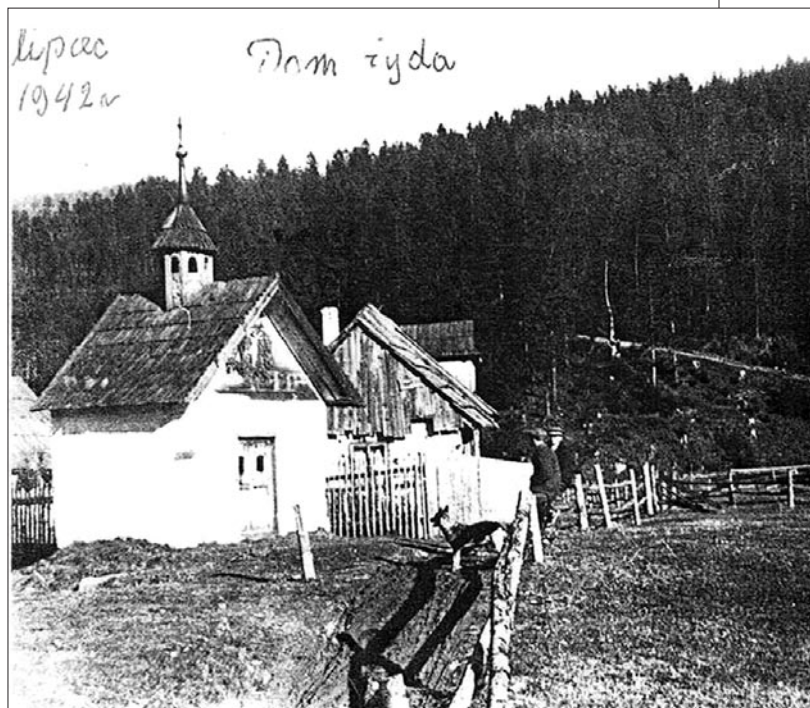
Dom, sklep i karczma Buchsbaumów