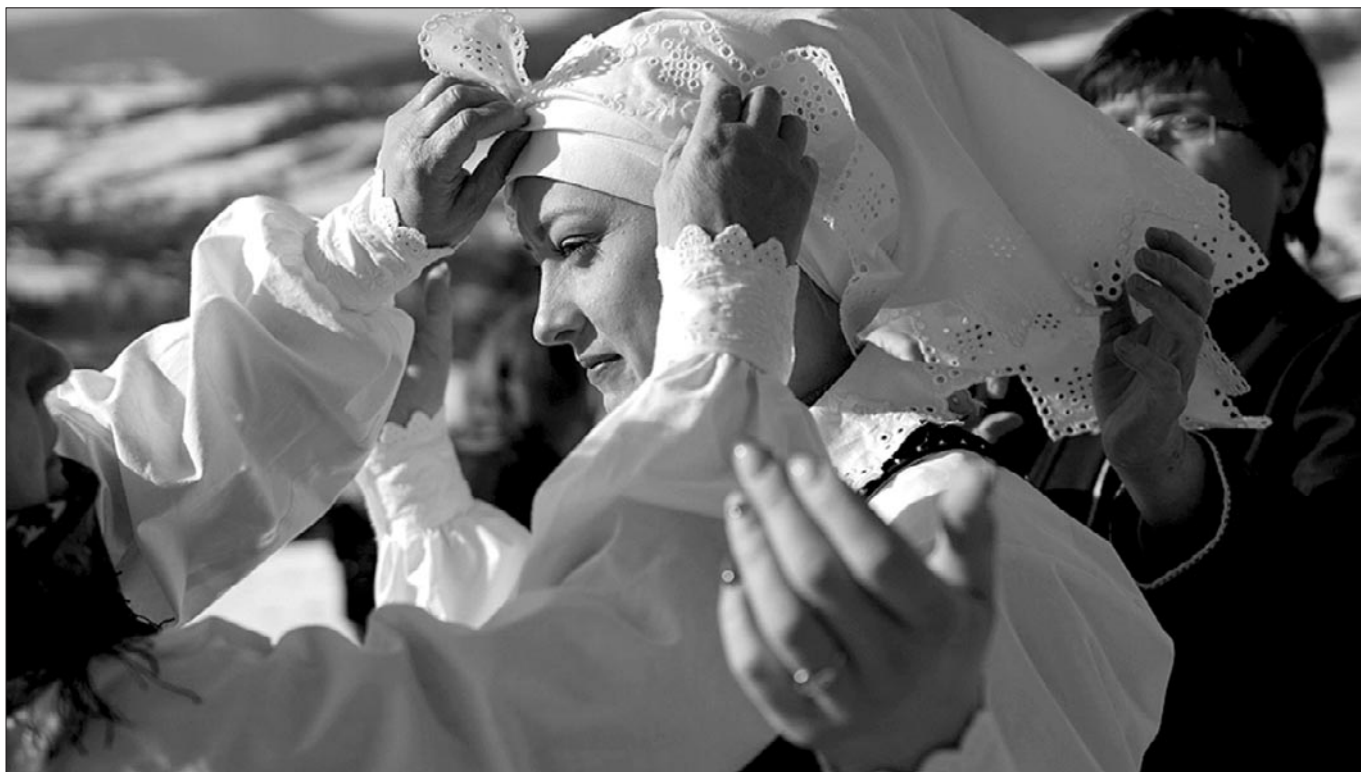
FOT. STOWARZYSZENIE FILMOWE – WSPY KULTURY