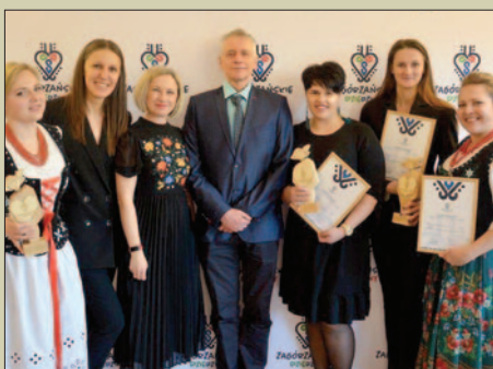
Pierwsi użytkownicy znaku promocyjnego ZAGÓRZAŃSKIE DZIAŁY STR. 12