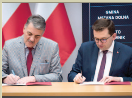
Dofinansowanie na drogę gminną Kasina Wielka – Gruszowiec STR. 7