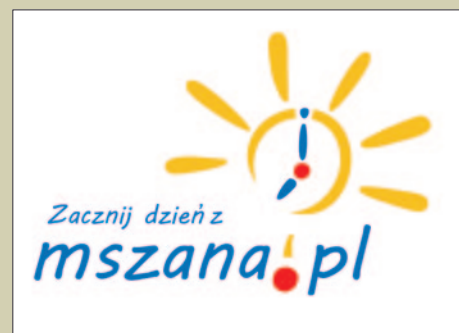
Zaczynij dzień z mszana.pl STR.14