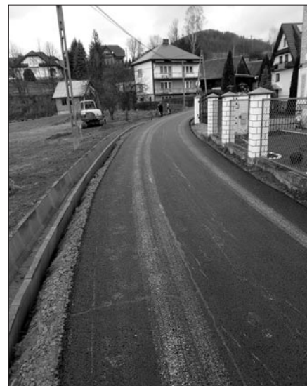
Droga do Osiedla Bartoszki w Kasince Małej