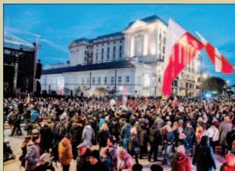
„Echo Gór” w Warszawie STR.10