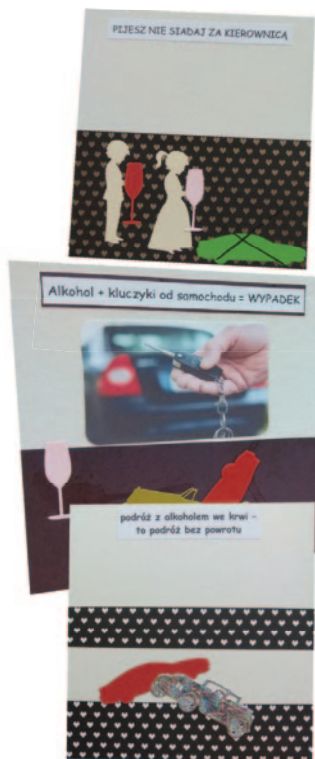
Martyna Hudomięt, kl. 3 ZSiP w Olszówce