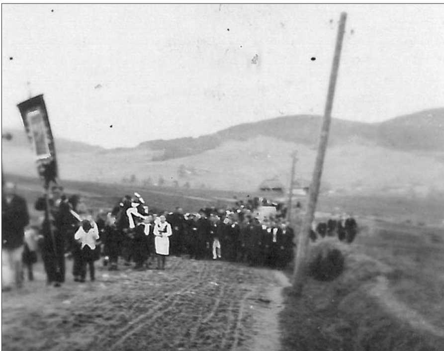
Kondukt pogrzebowy ofiar egzekucji w Kasinie Wielkiej