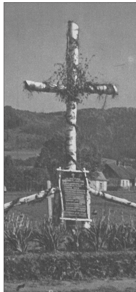
Pierwsza mogiła ofiar II wojny światowej zlokalizowana na cmentarzu w Mszanie Dolnej