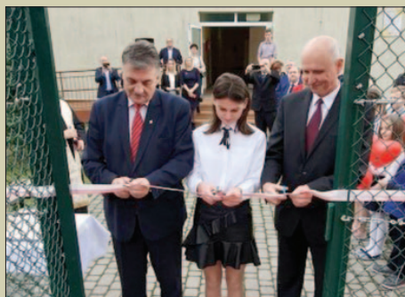
Sport – bogaty skarbiec wartości STR.13