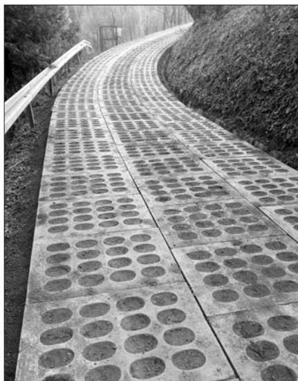
Wyremontowana droga na os. Żądły w Kasince Małej