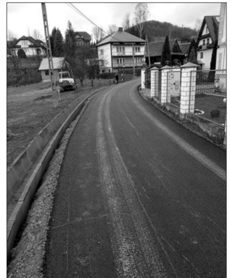
Droga do Osiedla Bartoszki w Kasince Małej