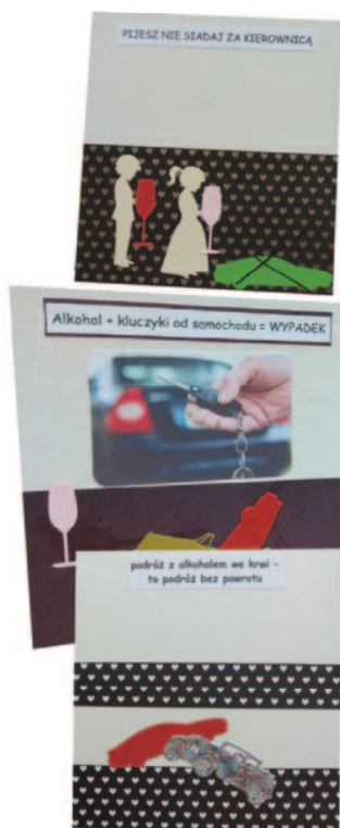
Martyna Hudomięt, kl. 3 ZSiP w Olszówce