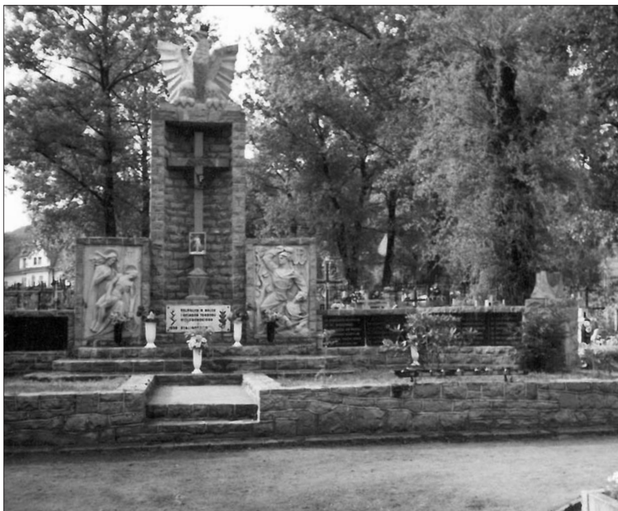
Pomnik ofiar II wojny światowej zlokalizowany na cmentarzu parafialnym w Mszanie Dolnej

i paru tysięcy uczestników, przewiezione zostały z Kasiny Wielkiej do Mszany Dolnej.