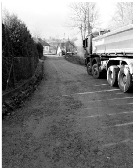
Remont drogi na os. Żury Łabuzy w Olszówce

PRACOWNICY REFERATU INWESTYCJI I ZAMÓWIEN PUBLICZNYCH