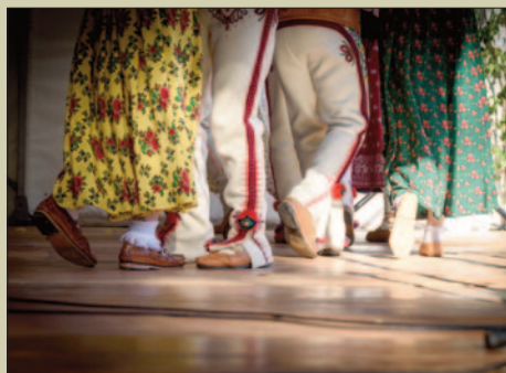
Pierwszy Zagórzański Festiwal Folkloru i Tradycji STR. 14