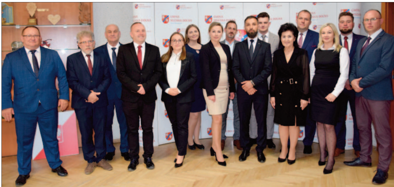
Rada Gminy Mszana Dolna IX kadencji 2024-2029