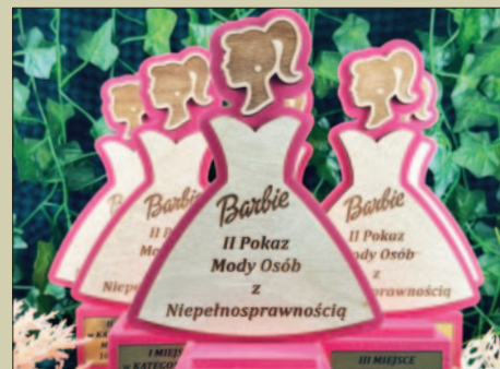
II Pokaz Mody Osób z Niepełnosprawnościami STR. 26