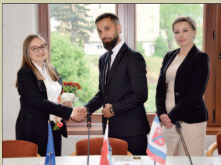
Pierwsza Sesja Rady Gminy IX kadencji samorządu STR. 8